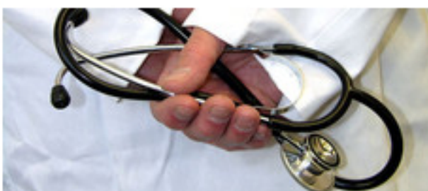
Arzt des Vertrauens

Sendung vom 01.03.2010, 15:05 bis 16:00 Uhr